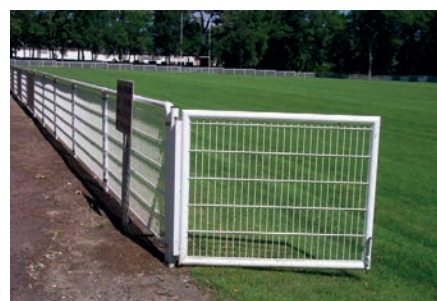
Remplissage double fils