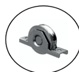
ROUES Ø 160

Anthracite ● Vert 6005 ● Autres coloris sur demande