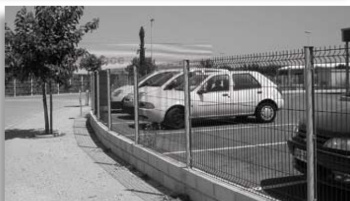
Clôture avec des panneaux Médium Eurus®

Le panneau Médium Eurus® se pose très rapidement à l'avancement, en scellement au sol sur terrain plat ou dénivelé, ou dans un muret.